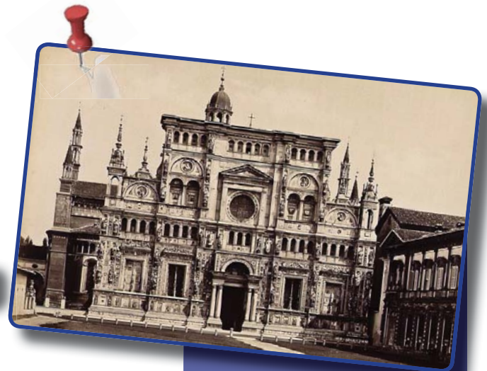
Certosa di Pavia