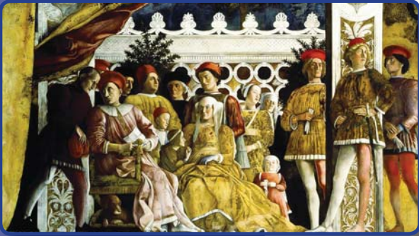
Andrea Mantegna Camera degli Sposi, Mantua