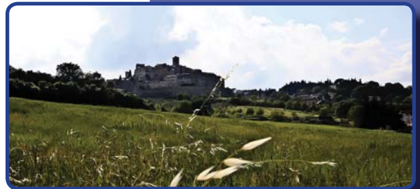
Hier werden wir wohnen: Anghiari

Individuelles Abendessen (wir haben Empfehlungen!) und letzte Übernachtung in Anghiari.