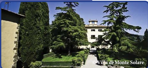
Hier werden wir wohnen: ****-Hotel Villa di Monte Solare

Individuelles Abendessen und zweite Übernachtung in Villa di Monte Solare.