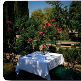
© Domain de la Petite Isle

Bewertung von booking.com, Frank: 9. Oktober 2011 „Sehr schöne Hotelanlage, sehr gutes Essen, guter Services“